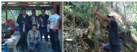
Taller de elaboración y colocación de trampas para broca de café, en la comunidad de Palmira, La Concordia, Chiapas.

Sinds het begin van het regenseizoen in juni, zijn de toepassingen van organische fungiciden uitgevoerd. Dit vond plaats na de controle op roest.