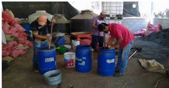
Taller de preparación de Biofertilizante Solidaridad en la cooperativa Comon Yaj Noptic.

Tijdens de maand mei werd er een trainingsworkshop gehouden in de uitwerking en bestrijding van ziekten en plagen voor de gemeenschapstechnici van de coöperaties.