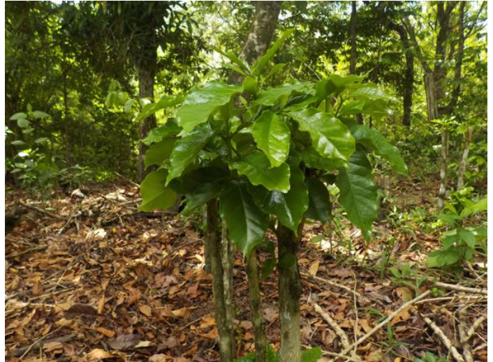
Hantering van weefsels: hoog snoeien

De training en toepassingen van fungiciden gaan gepaard met de uitwerking van organische meststoffen en punctuele toepassing in de verschillende productiegebieden.